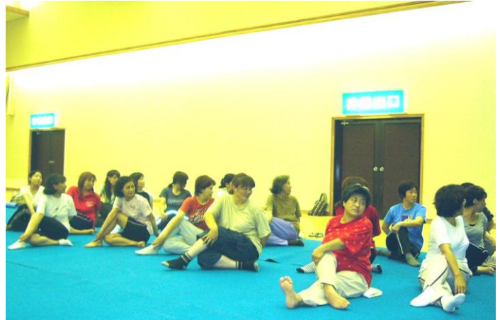
公民館ホール（旧改善センター） 20:00～21:30

呼吸の仕方（鼻から吸って口からはく方法）が、難しいですね。 次回は、「スタッフ会議」におじゃまする予定です。