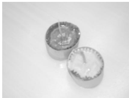
できあがったローソク