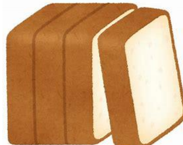
↑これくらいが美味しい♡