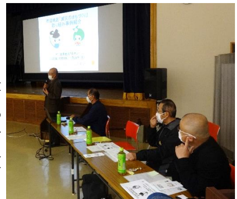
↑これが市辺(熱い!)4人組

とにかく熱い方たちでした。あの熱意にはホント頭が下がります。ああいう人がリーダーシップをとれば、物事は進んでいくのだろうなと思いました。1人が頑張ってるだけじゃなく、いっしょに行動する仲間もちゃんと揃っているのでしょう。この熱意を注入されて行動する人が湖東地区にも現れることを願っています。