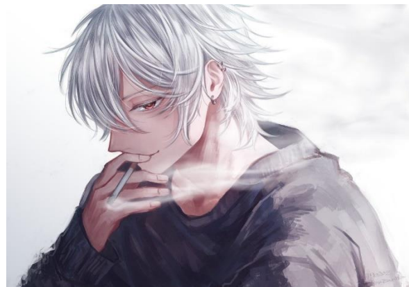
↑現在の食いしん防（イメージです）

皆さんもくれぐれもストレスにはご注意ください。円型に白髪が生えている人を見かけても、イジメないであげてね。