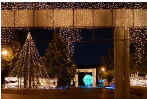
8月 コトナリエの開催