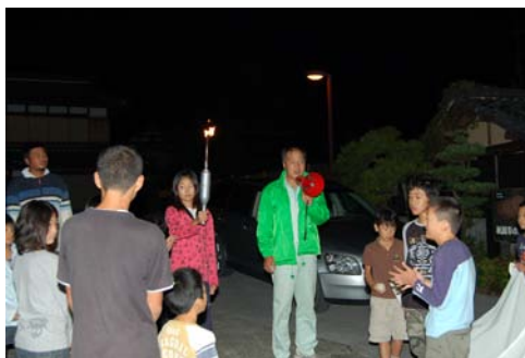
10月 スポーツフェスタ 聖火リレー実施