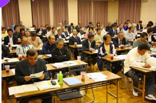
5月 まちづくりサポーターを委嘱