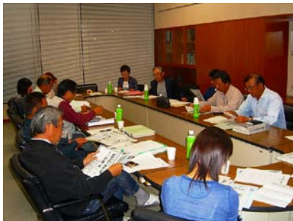
毎月 運営委員会で協議