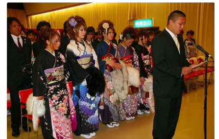
1月 二十歳のつといを支援