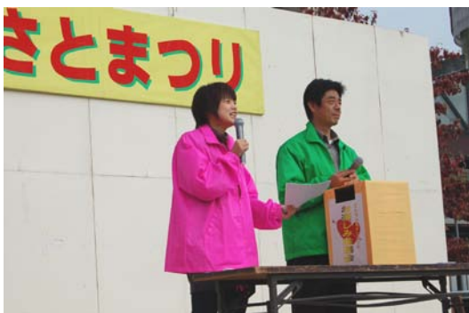
11月 ことふるさとまつりを開催