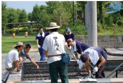
7月 コトナリエの準備