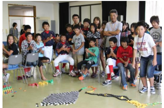
協力してドミノを完成

子どもたちは合宿期間中、決められた行程に従って規則正しい行動をし、自分自身でやり遂げる力を身につけました。