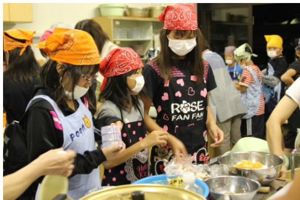
夕食の豚汁・手巻き寿司の用意