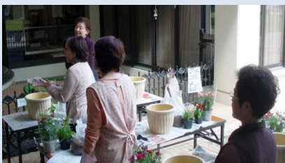
四季の花に親しむ教室