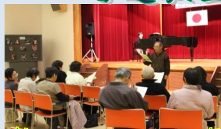
懐かしのメロディ教室