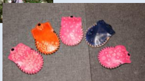
レザークラフト教室