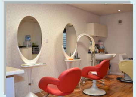
白色を基調にした店内