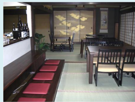
落ち着いた雰囲気の店内