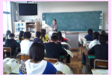
ゲストティーチャー 6年