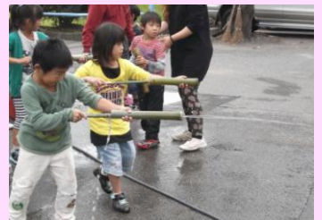
手作り竹水鉄砲あそび 1年