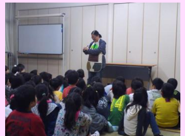
読み聞かせボランティア 中学年