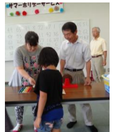
ビンゴゲームをする参加者

なお、湖東地区まちづくり協議会は、会場の提供やビンゴゲームの景品などの協力をしました。（高田）