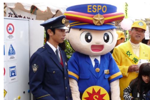
交通安全意識を高めるコーナー（ことうふるさとまつり）