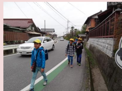
グリーンベルトを通学する小学生

妊産婦に対しては母子手帳を渡した時から支援をしている。保健師にも積極的に地域に出てもらい、育児不安を抱える人の相談事業も行っている。また保健センターでは就園前の相談をするなど、子育てしやすい環境づくりに努力している。