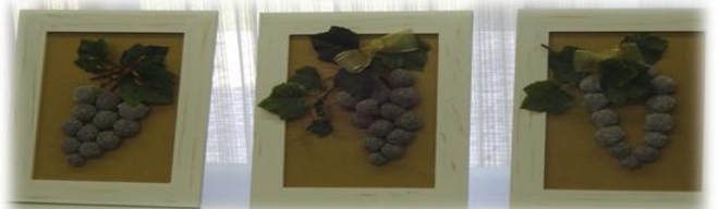
6月28日 心癒されるポップリでアレンジ