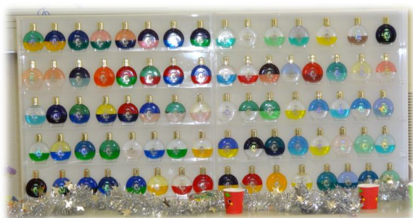
10月18日 心とカラダを元気にするカラーセラピー