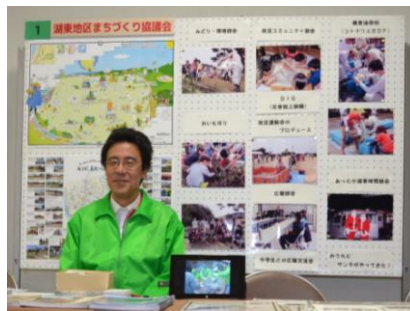
“湖東まち協”展示ブース

来場された方からは、「日頃の活動が、コンパクトに説明されていて分かりやすかった」との声をいただきました。今後も、あらゆる機会を通じて住民の皆さんに情報発信をしていきたいと考えています。