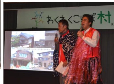
DIGについて紹介する防災部員