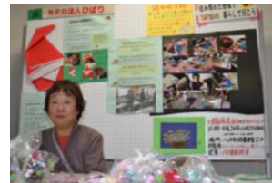
“NPO 法人ひばり”の展示ブース