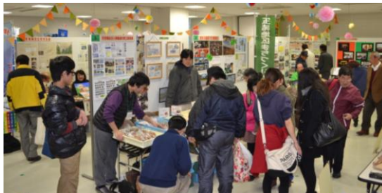
“わくわく ころぼ村”会場の様子