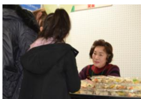
“笑楽”の展示ブース