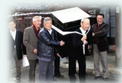
厨子を背負う新神主