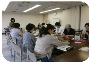
簡単なおもちゃ作り