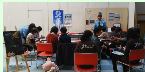
前回のアプリ登録会の様子