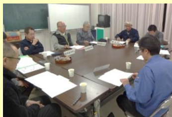
第二小ブロック会議

2月には、防災ネットワークの第二小と支所ブロックの会議が、それぞれ行われました。3月には、第一小ブロックと、今年度の締めくくりとなる役員の方の会議も開かれます。詳しくはHPをご覧くださいとして、防災ネットが生まれてこの1年、這い這いから立ち上がろうとしているところです。次年度は歩き始めることになるでしょう。どうかあたたかく見守ってくださいね。各自自治会がどのブロックに属するかは次号掲載します。