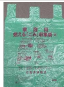
中部清掃組合の燃えるゴミ袋

【お問合せ先】 東近江市役所 廃棄物対策課 TEL 0748-24-5636 | P 050-5801-5636 湖東支所 TEL 0749-45-0511 | P 050-5801-0511