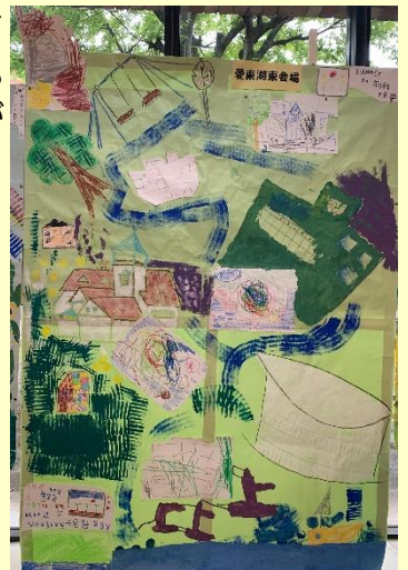
サマホリで制作された作品