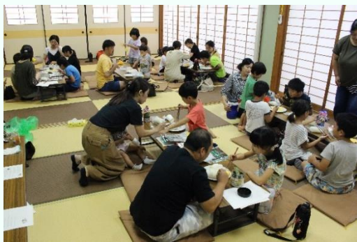
ハイゼックスで大盛り上がり

食欲が減退する季節にこそ、防災食で夏バテをぶっ飛ばそう!ということで、サマホリと横溝ニュータウン自治会が、それぞれ親子でハイゼックス・クッキングを体験してくれました。