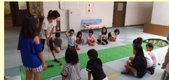
ニュースポーツの様子

ニュースポーツでは、“ストライクボール”が大盛り上がりで、館内に歓声が響き渡りました。初めて会う友達と協力して勝利を目指す姿がとても印象的で、改めて“子どもって素晴らしい”と思いました。