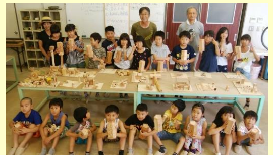
木工教室に参加された子ども達

木工教室では、「ロボット作ったねん!」、「貯金箱の宿題できたわー」と、思い思いに素敵な作品が出来上がりました。また、コミセンの職員さんがポップコーンを作ってくださり、久しぶりに会う友達と話をしながら、楽しくいただきました。