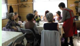
おしゃべりサロンの様子