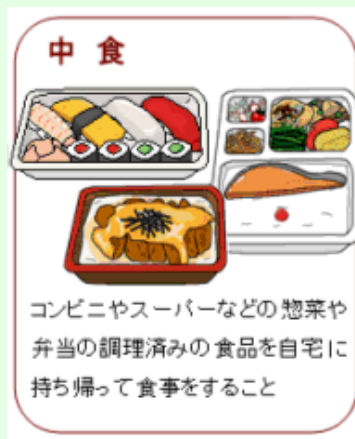
コンビニやスーパーなどの惣菜や弁当の調理済みの食品を自宅に持ち帰って食事をする