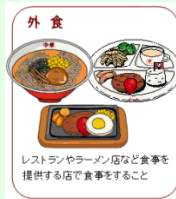
レストランやラーメン店など食事を提供する店で食事をする