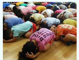
低い姿勢で守ります