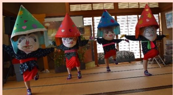
どてかぼちゃさんの腹踊り