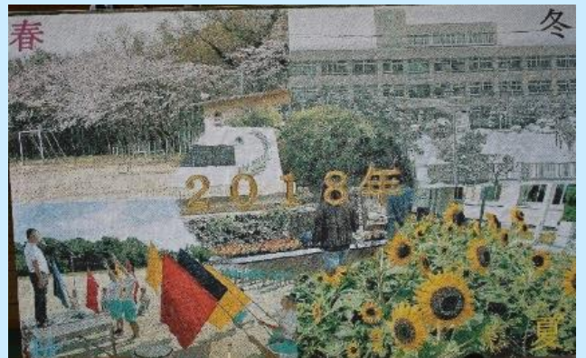
巨大モザイクアート