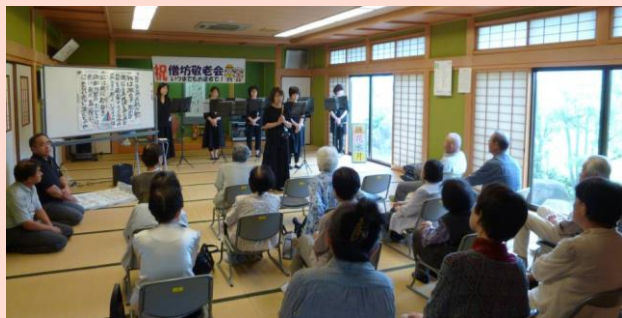
鏡花水月さんのよし笛演奏