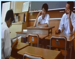
人権映画のワンシーン