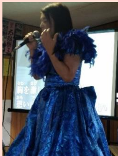
三友会さんの歌謡ショー