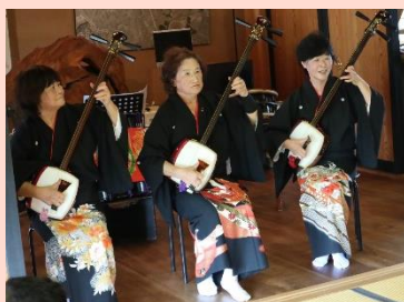
三味線の歌謡ショー