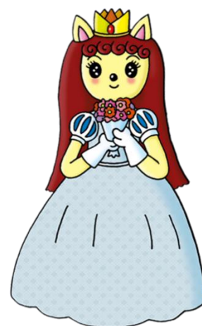
「テレビゲームききいっぱつ」の