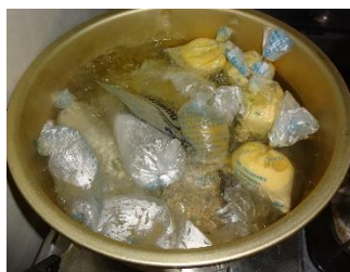
オムレツと ミネストローネ→

できあがったほかほかのオムレツを一口食べると… 「きゃーっ、美味しい！」中はトロトロのふんわりで、ほっぺが落ちそう！