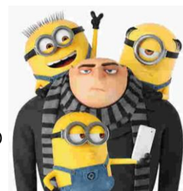
グルーとミニオンズ

ああっ、また個人的な話を延々としてしまった！ それがこのコーナーの特徴なのでお許しを。この後の本編も読んでね。