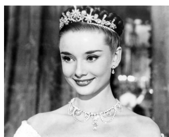
「ローマの休日」のアン王女