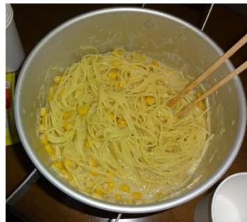
コーンクリームパスタ