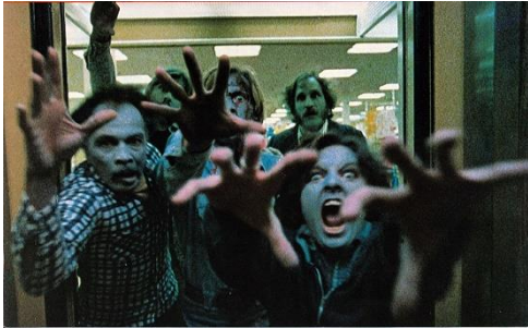
↑ゾンビ映画の金字塔「ゾンビ」 マジで怖い

実際の災害ではどんな突発事態が起きるかわからない。それを自主防災組織は、機転とチームワークで乗り切っていかなければならない。そういう目で見ると、この映画は「危機対応」を描いているといえるので、とても参考になります。