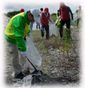
清掃作業に励む参加者

②主催者：東近江市、東近江市さわやか環境づくり部会、美しい湖国をつくる会東近江支部