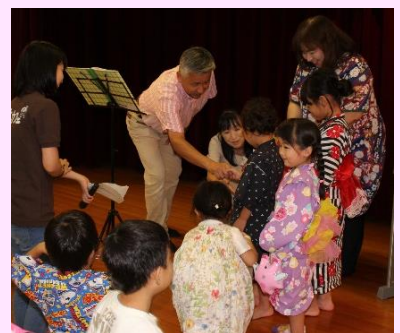
ゆうすずみ会の様子