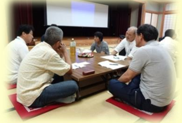
課題に取り組む参加者

うーっ、こりゃ難題だ！ 良いアイデアを思いつくためには、美味しいものをいっぱい食べなきゃ……って、お腹と背中の距離が広がっていくはずだよ！（秋彦）