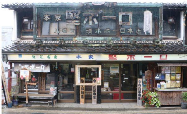
これが長浜にある堅ボーロ本舗。老舗の風格！