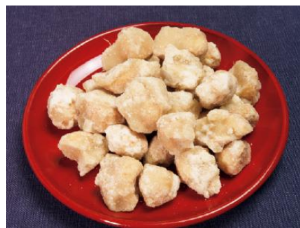
クセになる美味しさ。見た目もキュート！