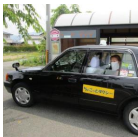
大沢町の タクシー乗り場