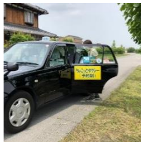
湯屋町の タクシー乗り場