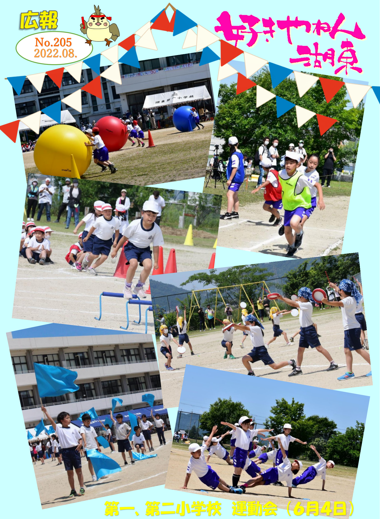
第一、第二小学校 運動会 (6月4日)