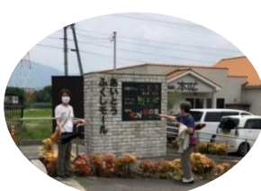
あいとうふくし モールに到着